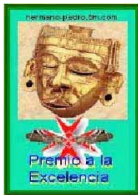
Con el apoyo fraternal del Premio «Xipe Totec» del «hermano pedro».

* El Grado 33 del Director de la Revista, le ha sido otorgado por el Supremo Consejo del 33 y último grado del Rito Escocés Antiguo y Aceptado para la Jurisdicción Masónica del Sureste de los Estados Unidos Mexicanos, con sede en Yucatán, el 1º de agosto de 2001.